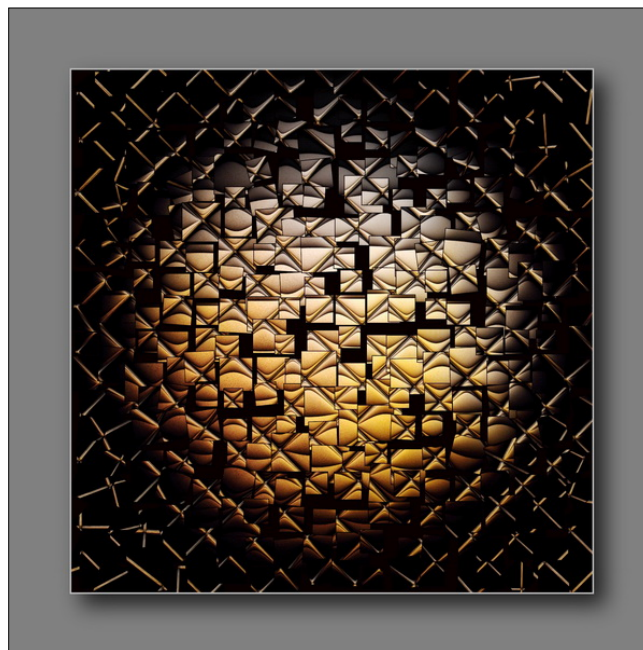
„golden impression 30“