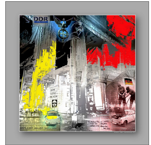
„Brandenburger Tor 2“

Eigener Bestell-Shop im Internet: www-utekirchhof-digital-kunst.my-xxlpix.net