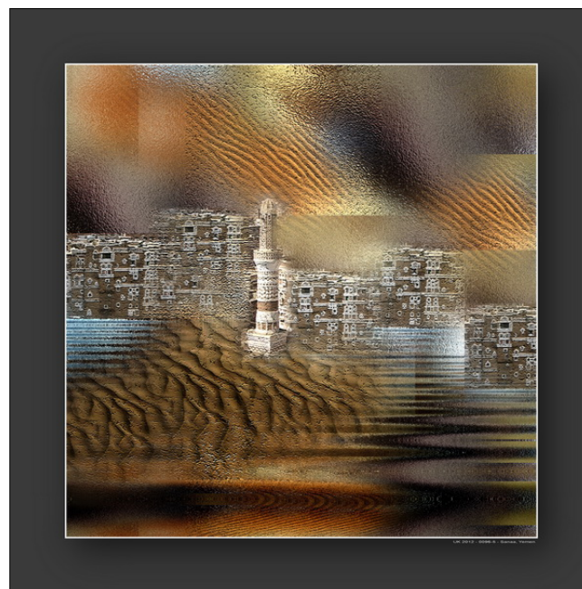
“Sanaa - Yemen”